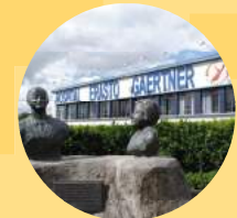
Hospital Erasto Gaertner