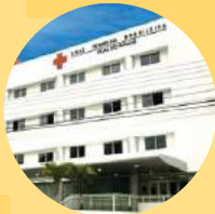
Hospital Cruz Vermelha