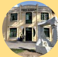
Hospital Pequeno Príncipe